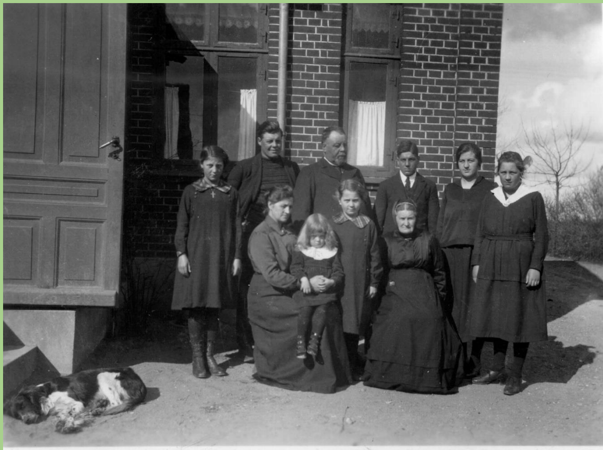
Familie i forstaden