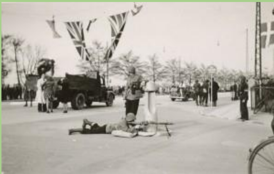
Modstandsfolk 5. maj 1945