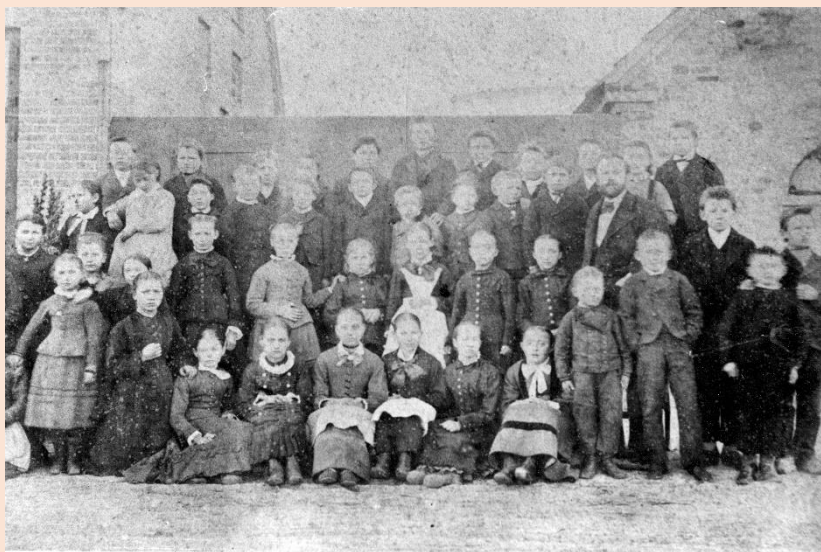
Brøndbyøster skole 1881

Du skal nu lade dig inspirere af andres fortællinger til eftertiden og forestille dig, at du er historiker, der sørger for, at eftertiden får kendskab til den helt specielle tid, du lever i lige nu.