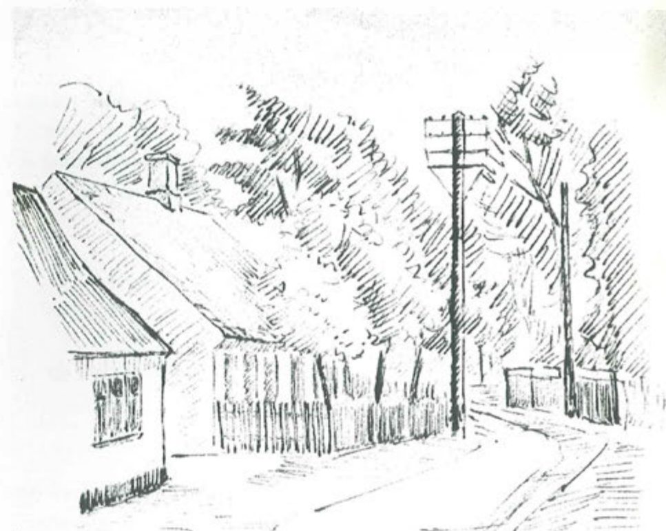
Historiens Hus Hvidovre Alarmpladsen 3 Avedørelejren 2650 Hvidovre