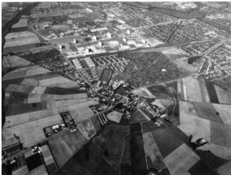
Kilde: Brøndby Kommune – flyfoto 1958.

Brøndbyøster landsby i midten. Mod højre kolonihaveområdet med ”Lyset”. Det hvide felt er ”Lysets” festplads. I højre side, lidt over midten Rebæk Sø. Øverst højre hjørne ligger Damhussøen. Bemærk, at Rebæk Søpark-bebyggelsen endnu ikke er opført.