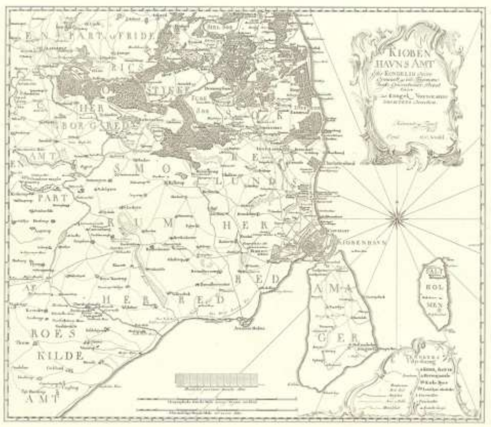
Kort over Kjøbenhavns amt 1766

Det var ukendt land, som ingen skrev om i det 19. århundrede. På landkort fra den tid ser man selv skovstier i de kongelige skove nord for København tegnet ind. Vestegnen var fladt landbrugsjord, hvor enkelte landsbyer ses på kortet.