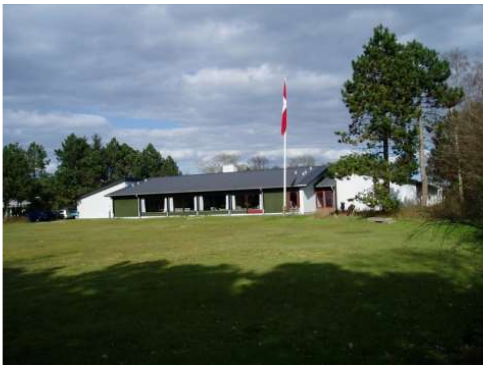
Skodshoved