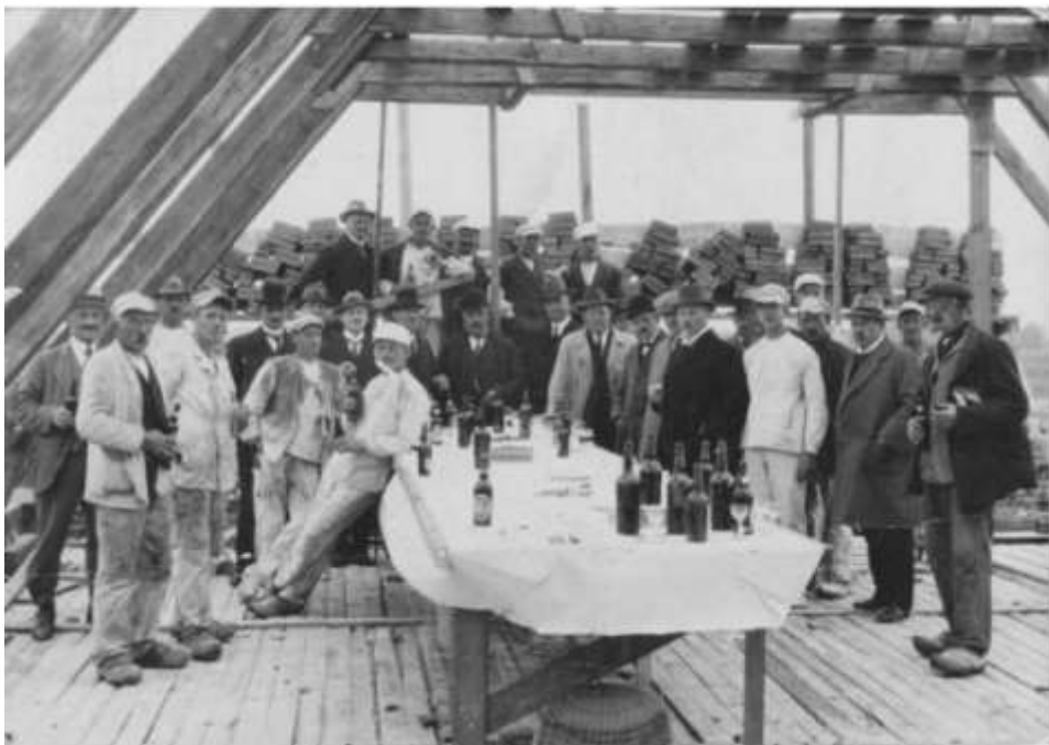
Rejsesilde på Kettevejskolens første del, 1923

skoler – og den 3. af de skoler, der overhovedet har været i kommunen. De to tidligere er begge bevaret og fungerer henholdsvis som aktivt tilholdssted for Hvidovre Lokalhistori-