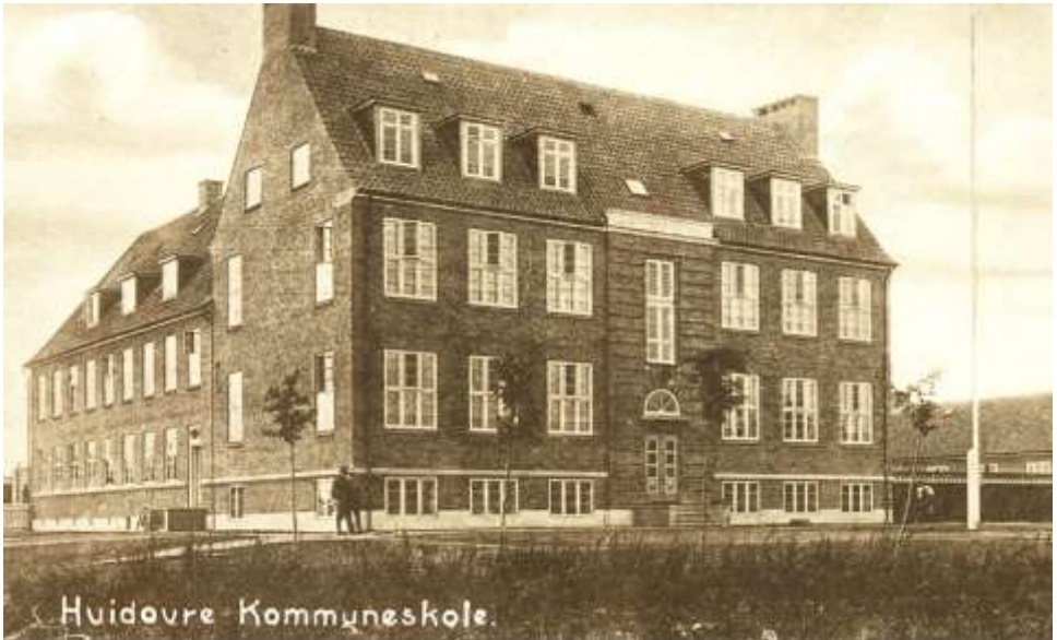
Sønderkærskolen åbner i 1924

bejdes ikke i dag” vidner om hans engagement i sagen og muligvis om hans politiske holdning.