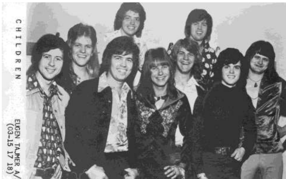
Children - Osmonds

gav et ordentligt brag – Valby gasværket var i samme øjeblik sprunget i luften! P. G. Hansen indledte timerne med at lave skæg og ballade de første 5-7 minutter – derefter forventede han disciplin, men det var ikke alle, der kunne administrere det.