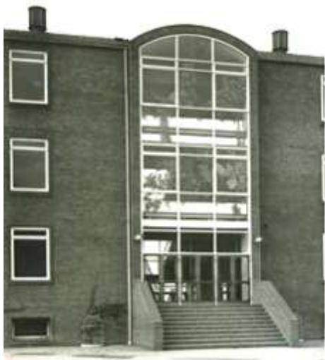
Sønderkærskolen. Ny Fløj bygget i 1949.

læumsskrift i 1999 om fodbold og Sønderkærskolen. Med til-ladelse bringes følgende i ud- drag: