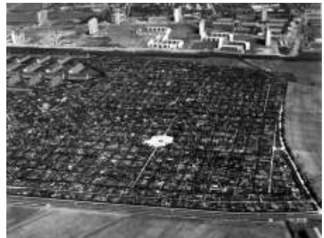
"Lyset" - se billedtekst på forrige side

hun med sine erindringer har føjet et kapitel mere til Hvidovres og Brøndbys lokalhistorie. Et kapitel om kolonihaverenes store betydning for brokvarternes befolkning i 1940'erne og frem til slutningen af 1960'erne. Uden Ritts