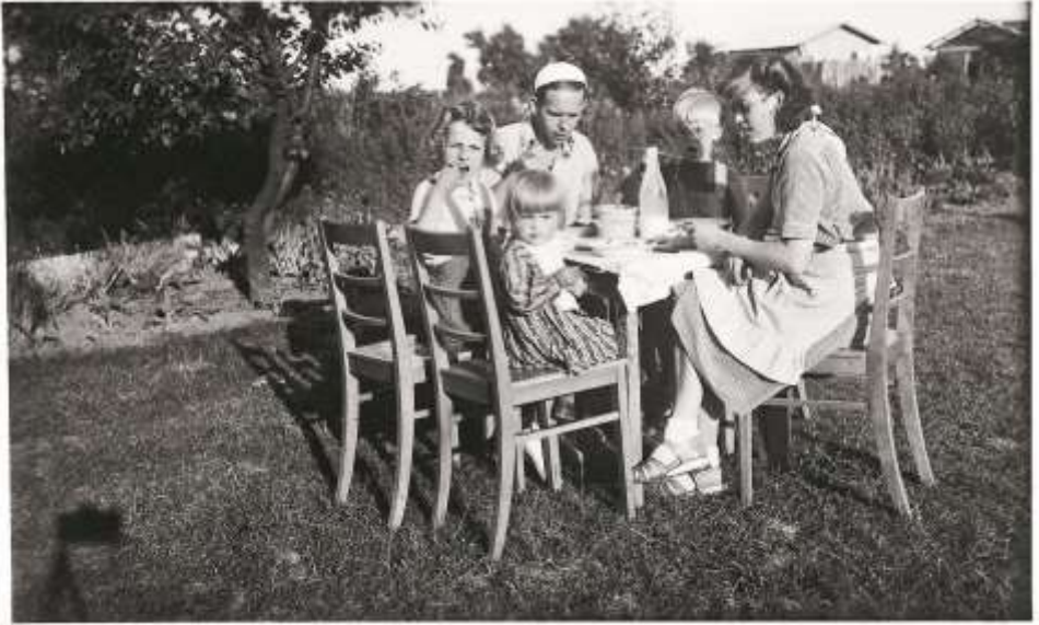
Jordbær til middag om sommeren i kolonihaven var det bedste. Her er hele familien. Ritts far har brugt selvudløser for at tage billedet.