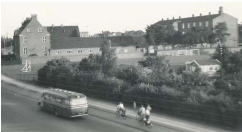
Hvidovrevej, Sønderkærskolen H.F. Rosenhøj 1953

Derefter fællesbord for en snævrere kreds, ved bordet