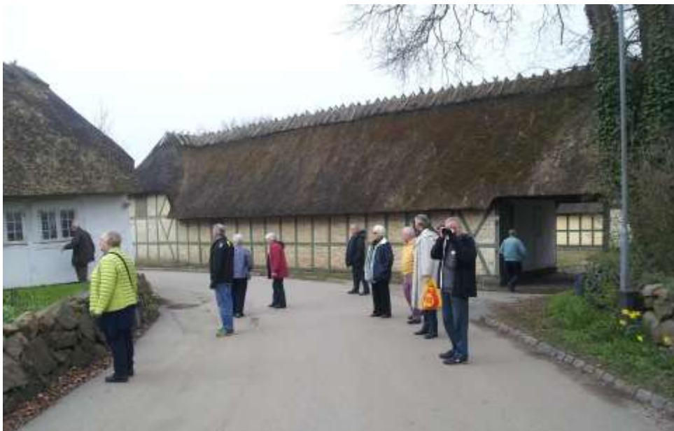
Udflugt til idylliske Viby med 11 fredede firlængede gårde

bugt, ligger der et hus så smukt” og tog det som udgangspunkt til at tale om fredning og bevaring . Lørdag formiddag var der bus-