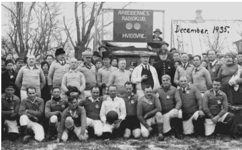
ARF - Hvidovre 1935

ARF-Multimedier – Avedøre/Hvidovre og Vestegnen