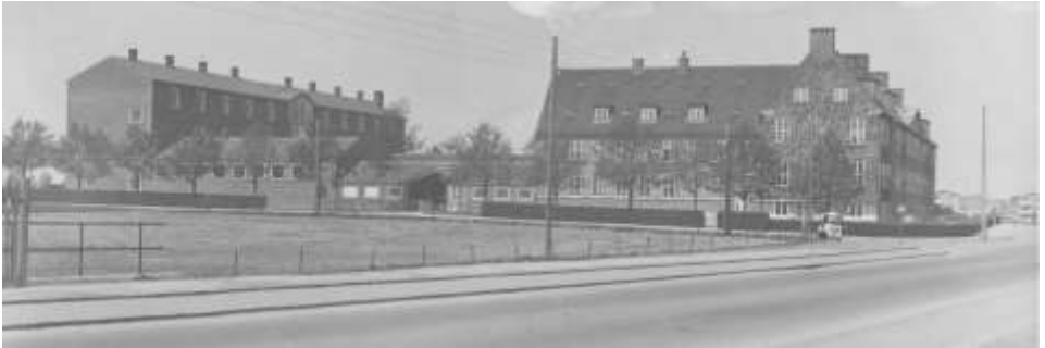
Sønderkærskolen set fra syd 1955

Det lykkedes ikke, men forældrenes indsats i og for skolen gennem de mange år er ros-værdig og imponerende.