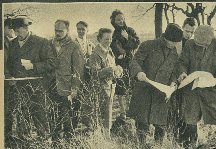
Der er gang i salget. Forleden solgtes 104 grunde på tre timer og dagen efter 150 grunde. Køberne studerer ivrigt planerne