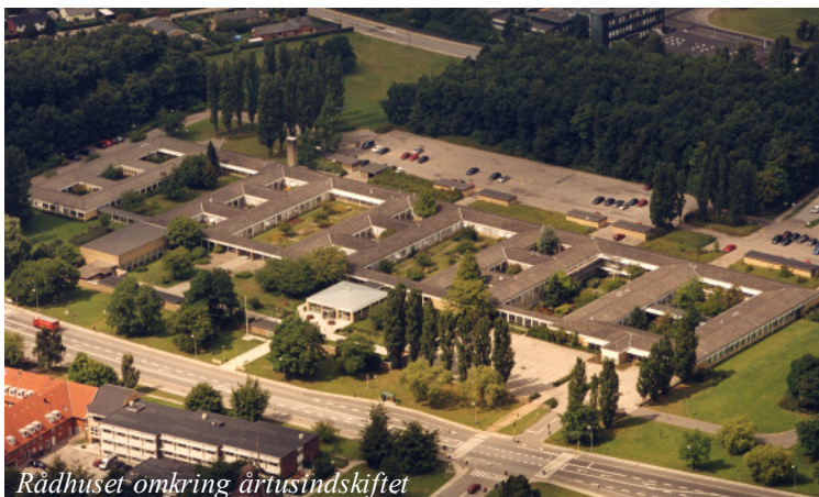
Rådhuset omkring årtusindskiftet

Siden er Brøndby Rådhus blevet udvidet, efterhånden som byen og administrationsbehovet voksede. Den sidste udvidelse blev foretaget i det nye årtusinde. Det var overbygningen på den nordlige fløj – en løsning, der var med på de oprindelige tegninger.