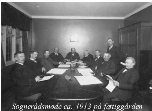
Sognerådsmøde ca. 1913 på fattiggården

Havde man ærinde hos kommunen, bankede man på hjemme hos datidens borgmester, sognerådsformanden, og da han i 1917 indførte kontortid, medførte det en vis bestyrelse blandt borgerne. Med tiden blev der indrettet et lille kommunekontor på loftet af fattiggården.