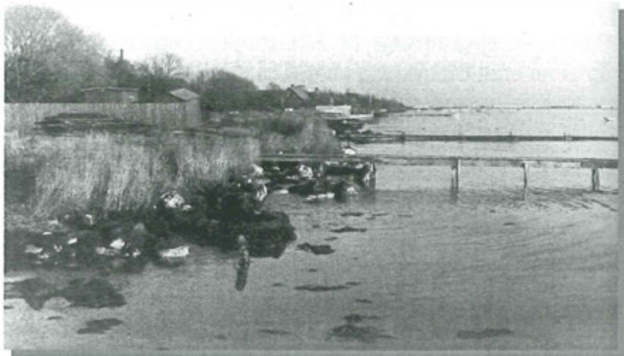
Brøndby Strand ca. 1950.

Efter en dejlig sommer med masser af sol og varme kommer jeg til at tænke på min barndoms lange gode sommerdage. Dengang var det rigtig sommer, sådan var det jo -- så vidt jeg husker?. Drengen glædede sig allerede i april, til at skifte til korte bukser. - være blandt de første der mødte op i denne sommerbeklædning. At stille op ude blandt kammeraterne, med blåfrosne knæ -- det var sejt.