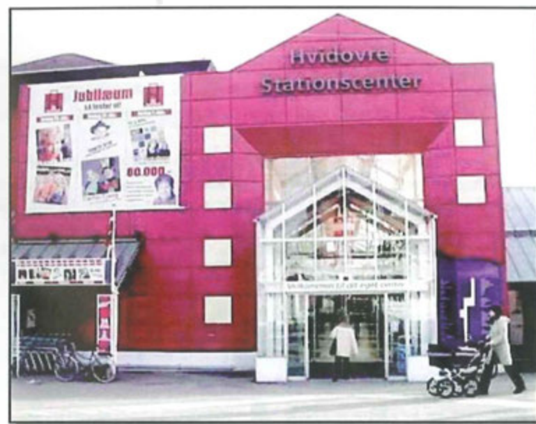
Hvidovre Stationscenter 25 år.