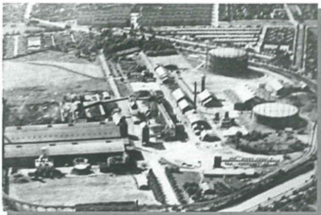
Valby Gasværk før ulykken

Her er endnu en skildring. oplevet af en, dengang, 10 årig Hvidovredreng.