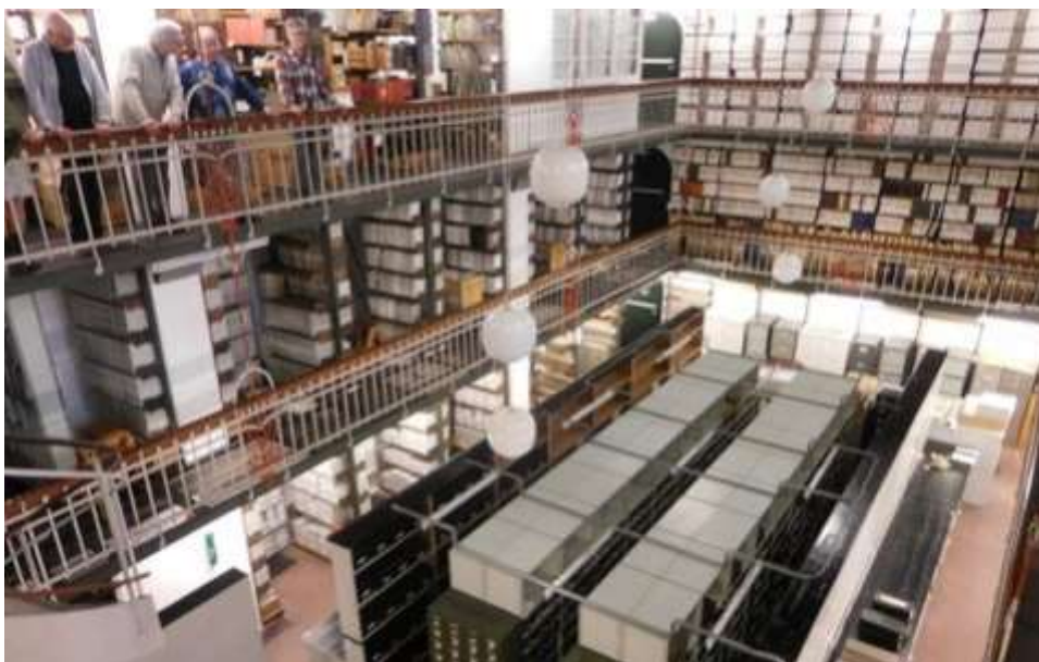
Det danske Magasin Foto: Finn Kristensen