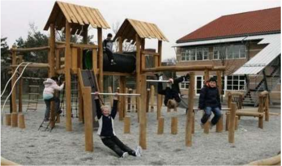
Skolegården på Enghøjskolen