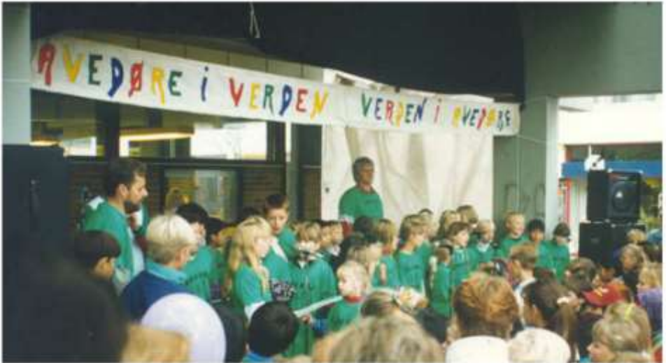
Enghøjskolen ved Mangfoldigheden

strandskolen kæmpede kraftigt imod denne beslutning. Og i september 2011 blev beslutningen ændret til, at det nu i stedet var Enghøjskolen og Sønderkærskolen, der skulle lukkes, og elever og personale flyttes til tre andre skoler i området. Beslutningen blev efter mange indsigelser stadfæstet på et møde i kommunalbestyrelsen d. 28. februar 2012. Lærerne på Enghøjskolen var lamslåede. Nok var skolens elevtal faldet til under 300 ele-