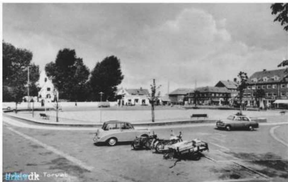
Hvidovre Torv - 1953