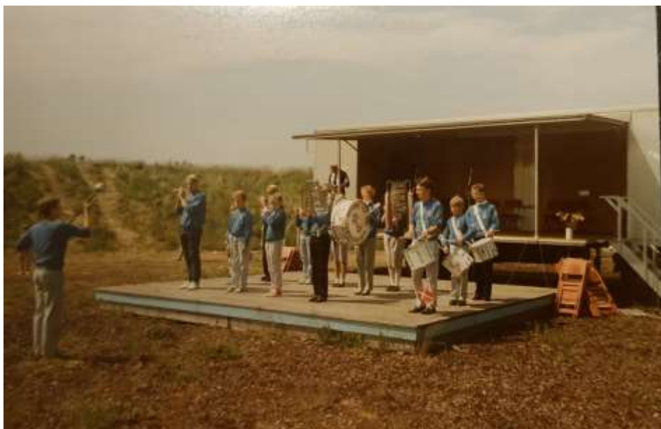
Tamburkorpsset spiller i amfiteateret ved Poppelgården 1989