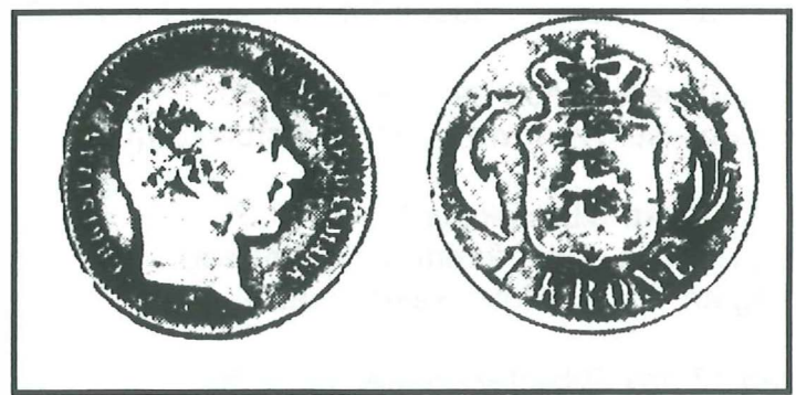
Dansk Krone 1875

Den kan købes på Hvidovre Lokalhistoriske Arkiv, Hvidovrevej 280 (kr.80) eller erhverves ved indmeldelse i Hvidovre Lokalhistoriske Selskab, Rytter-skolen, Hvidovre Kirkeplads 1. Betalt kontingent giver ret til et gratis eksemplar mod forevisning af "Hvidovre Lokalhistorie no.2" Tilbudet er gældende til d. 13.november 2000