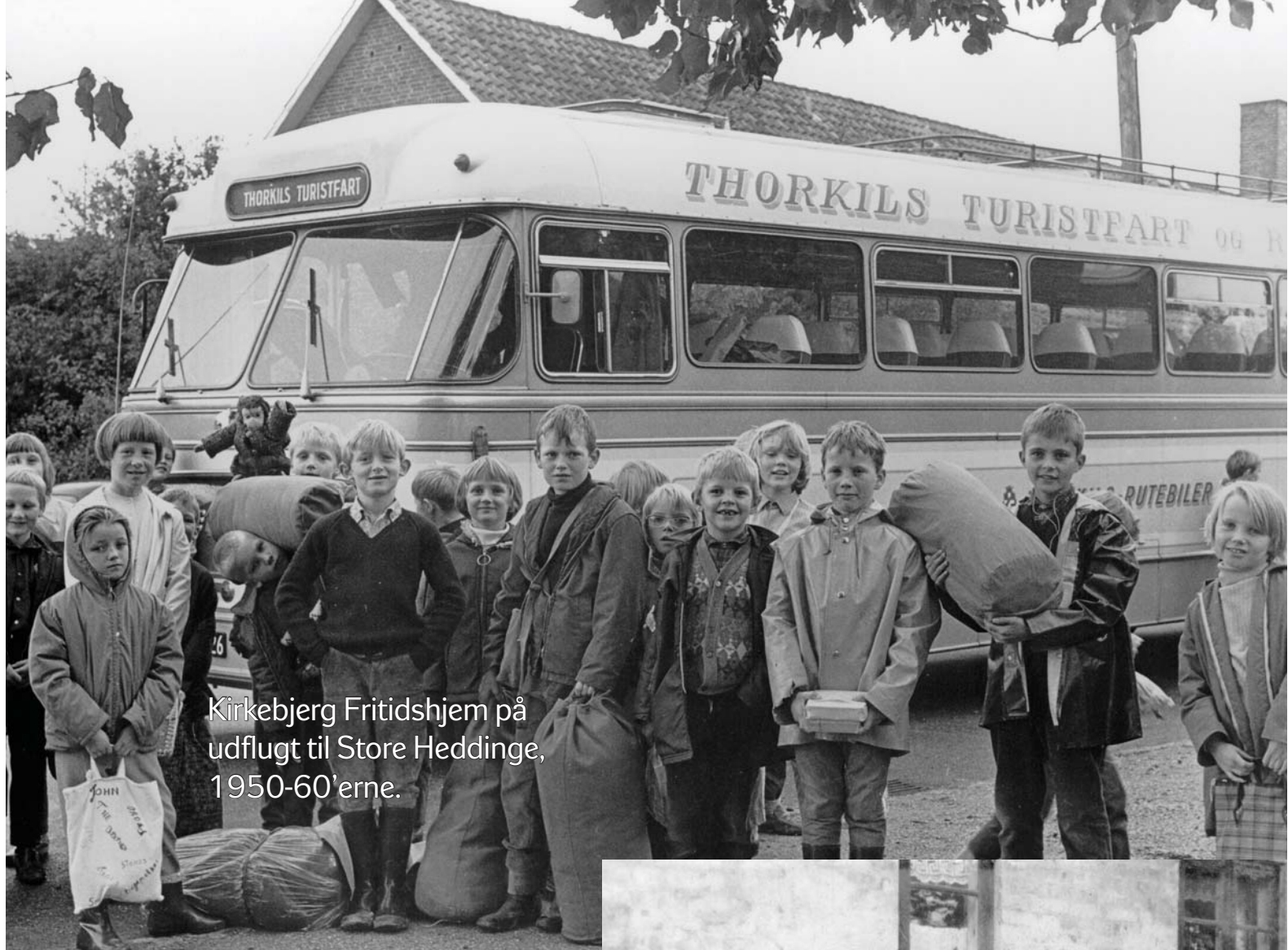
Kirkebjerg Fritidshjem på udflygt til Store Heddinge, 1950-60'erne.