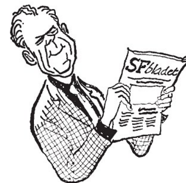
Tegning af Bo Bojesen

Stiftende kongres 15. februar 1959 på Holmegårdsskolen i Hvidovre