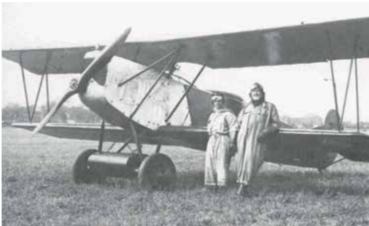
Fokker C.V. recognoseringsfly på Avedøre Flyveplads.

Ved Gammel Køge Landevej ligger Danmarks eneste større bevarede flyvemiljø fra tiden før 1945. Flyvepladsen blev anlagt i militærregi i 1917 på Avedøres excercerplads vest for Vestencienten, efter sigende fordi jorden her var trampet fast. Hovedårsagen til opførelsen af flyvepladsen var et voksende behov for en militær øvelsesflyveplads, der bl.a. skulle bruges til de mange soldater, der var udstationeret i Avedørelejren under 1. Verdenskrig.