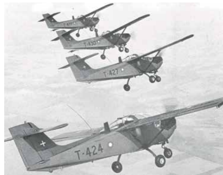
Propelfly af mærket Saab t17, der primært brugtes af Luftvåbnets Flyveskole til uddannelse af kommende piloter.

Anlægget bestod på denne tid kun af hangarerne, (som var specielt byggede til at kunne brændes af i en fart, hvis den militære situation gjorde det nødvendigt), 12 fly med kun to motorer og en drænet græsmark! Efter våbenstilstanden den 11. november 1918 blev alle militære aktiviteter dog nedtrappet, og pladsen lå derefter stille hen i nogle år.