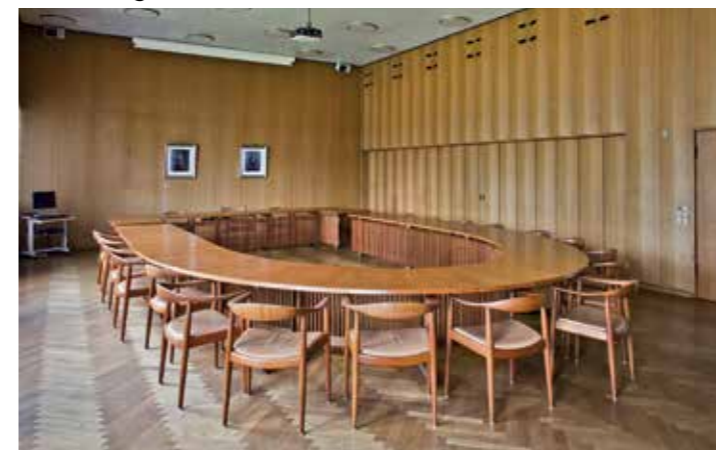
Byrådsalen i det nye rådhus.

Første etape af byggeriet omfattede kun en femtedel af det samlede byggeri, mens det endelige og fuldt udbyggede rådhus skulle give plads til samtlige kommunale forvaltninger.