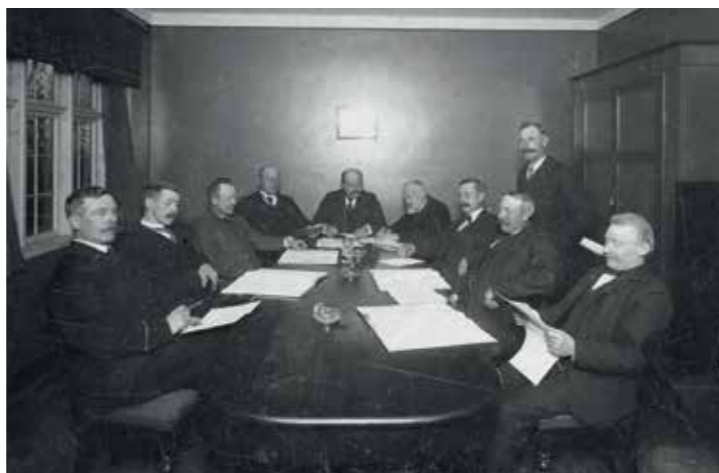
Brøndbyernes Sogneråde i mødelokalet på loftet af Fattiggården, ca.

Det første kommunale valg i Brøndby blev afholdt i 1841. Brøndby var den gang en lille landkommune med lidt over 1000 indbyggere, og de kommunale opgaver var til at overse. Havde man et ærinde hos kommunen, bankede man på hjemme hos sognerådsformanden, og da han i 1917 indførte kontortid, medførte det en vis bestyrtelse blandt borgerne.