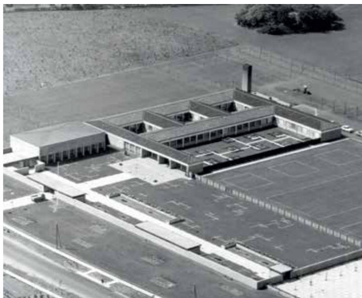
Luftfoto af Brøndby Rådhus 1959. 1. etape med byrådsalen og 1. fløj er udført. Omridset til de næste etaper er aftegnet på jorden.

Den 30. november 1959 slog Brøndbyernes Kommune for første gang dørene op for et helt nyt rådhus. Inden da havde man haft kommunekontor og rådhus på fattiggården, og siden hen på en gammel skole.