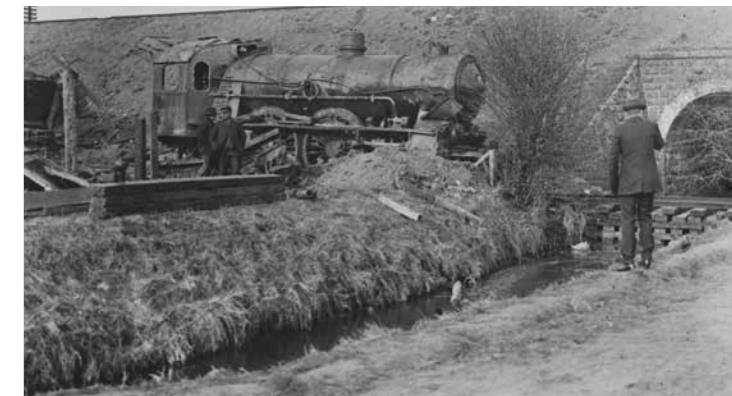
P904 er rejst op og ved at blive klargjort til at blive trillet væk.

Det, der vakte størst forargelse i dagene efter, var oplysningen om, at ligrøvere havde været på spil og fjernet værdigenstande fra de omkomne og fra efterladte kuffter. En portør havde set en mand, der havde haft fat i en afrevet hånd og havde forsøgt at få en guldring af den ene finger.