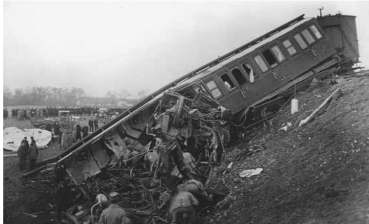
Hovedparten af de omkomne befandt sig i de tre forreste kupeer i Korsørtoget, der blev knust, da lokomotivet væltede.

Lørdag den 1. november 1919 indtraf en af de værste jernbaneulykker i Danmarks historie. Netop på denne dag, hvor Statsbanerne havde ekstra travlt på grund af skiftedagstrafikken, kørte et eksprestog fra Korsør direkte ind i et tog fra Kalundborg, der holdt stille på dæmningen mellem Hvidovrevej og Vigerslev - et område, der i dag er parkeringsplads for Hvidovre C. Med en voldsom kraft pløjede Korsørtoget sig gennem de fem bagerste vogne i Kalundborgtoget, som blev kvast til pindebrænde. Skaderne var enorme, og 40 personer mistede livet, mens 27 blev hårdt kvæstede.