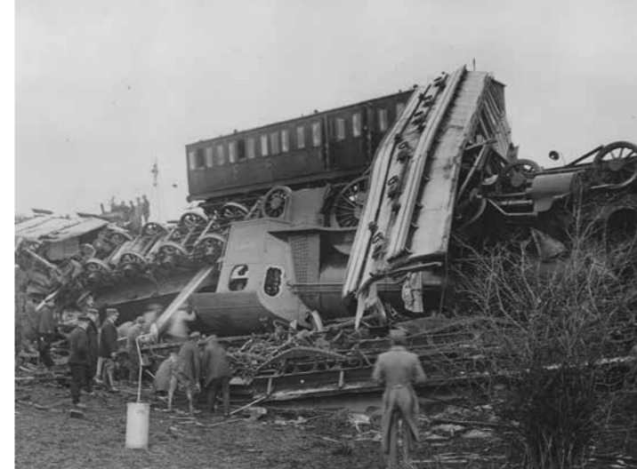
De fem forreste vogne i Korsørtoget fulgte med lokomotivet ned ad dæmningen og blev knust.